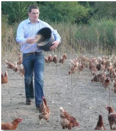
Konsequent biologisch: Die Hühner werden zu 100% mit Bio-Futter versorgt.