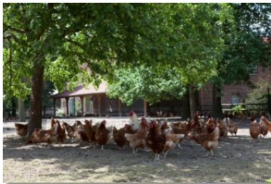
Ob Stallgebäude oder Grünauslauf - auf dem Hof der Altfelds gehen die Hennen ihre eigenen Wege.